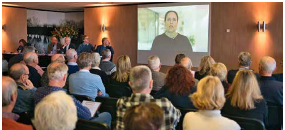
Minister Carola Schouten sprak de ALV toe met een videoboodschap