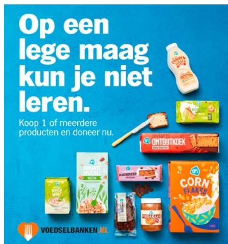
Getoonde producten zijn niet definitief, actiebeeld uit 2021

Albert Heijn houdt van 29 augustus tot en met 4 september een landelijke winkelactie ten behoeve van de voedselbanken met als thema "Op een lege maag kan je niet leren". Tijdens deze actie, die een herhaling is van vorig jaar, worden houdbare producten ingezameld. Over de exacte samenstelling van het in te zamelen pakket zijn we nog in gesprek. Uit ervaring weten we dat dergelijke acties meer opleveren als er vrijwilligers van de voedselbank tijdens de actieperiode aanwezig zijn. Een tip hierbij is om contact te leggen met lokale serviceclubs als Kiwanis, Lions, Rotary, Scoutingclubs etc. om een dagje mee te helpen. Het advies is, ook gezien de aankomende zomerperiode, vrijwilligers en serviceclubs nu al op te gaan schalen. Binnenkort volgt meer informatie