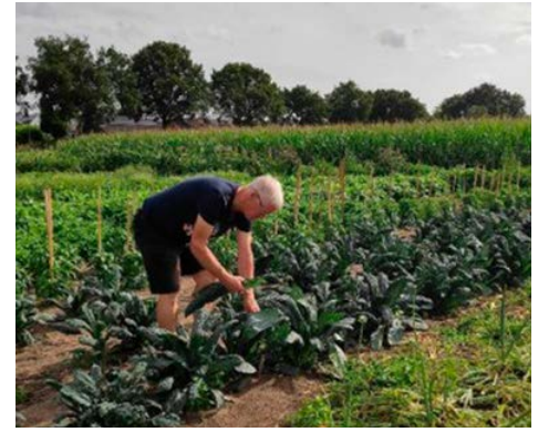
Voedseltuin Gooi & Omstreken

In totaal helpen wekelijks 42 vrijwilligers in Aalst Waalre aan het uitdelen van voedsel