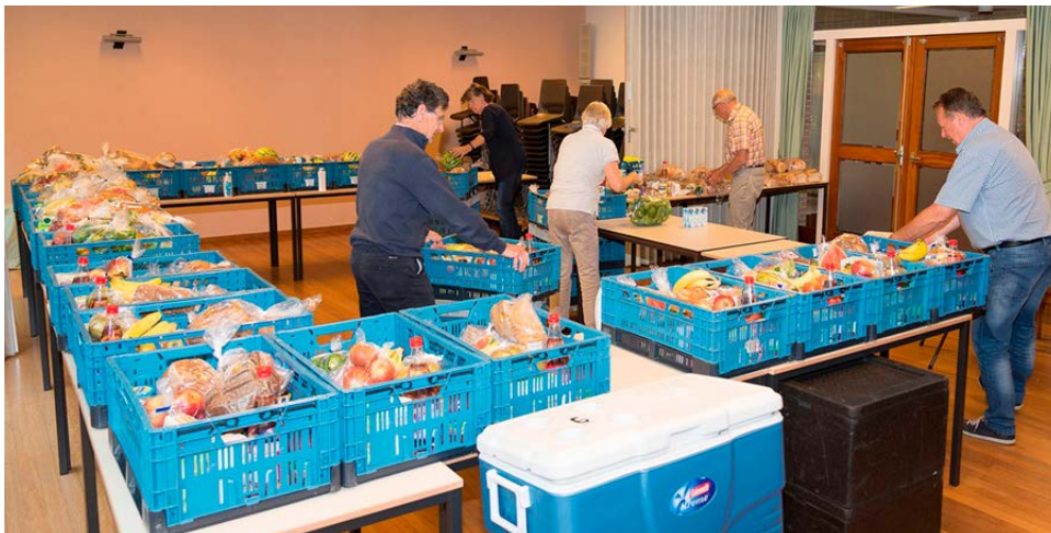
Voedselbank Aalst Waalre