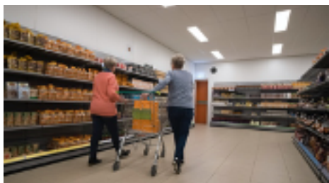
Klant en vrijwilliger bij winkel VB Arnhem